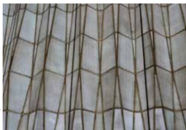
Oben: Frechen, Keramion, Keramikwand | Mitte: Velbert-Nevigés, Wallfahrtskirche Maria, Königin des Friedens | Unten: Duisburg, Kulturkirche Liebfrauen, Ausschnitt Nordfassade