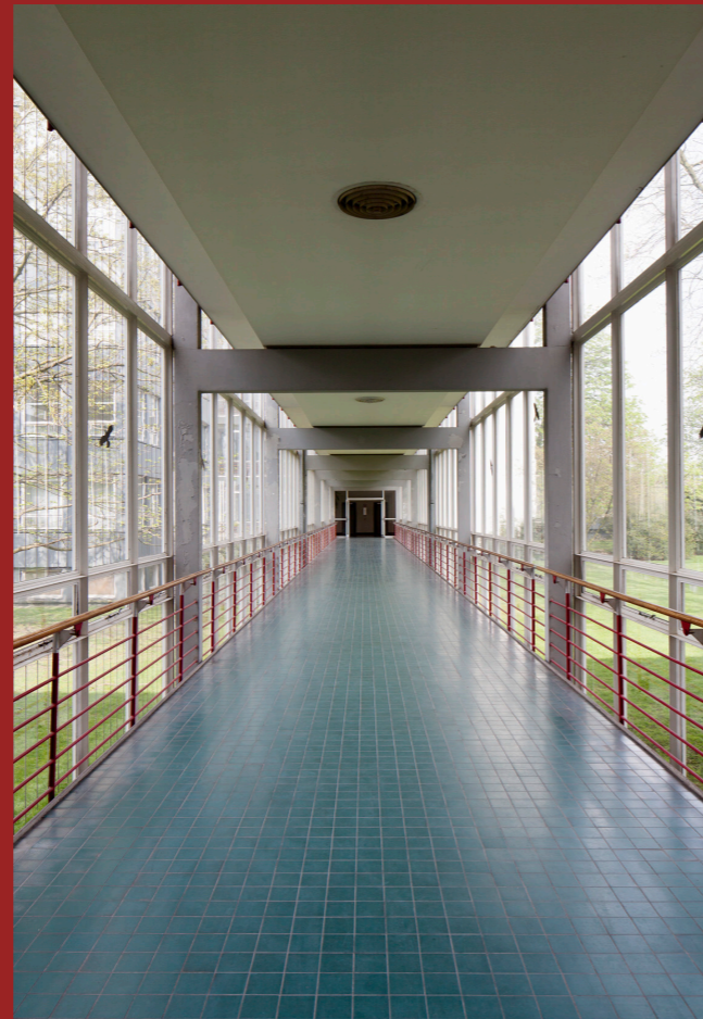
Krefeld, Stadthaus, Verbindungstrakt

Veranstalter: TH Köln/Fakultät für Architektur/Institut für Baugeschichte und Denkmalpflege und LVR-Amt für Denkmalpflege im Rheinland